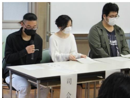
議長、副議長、総会をサポート