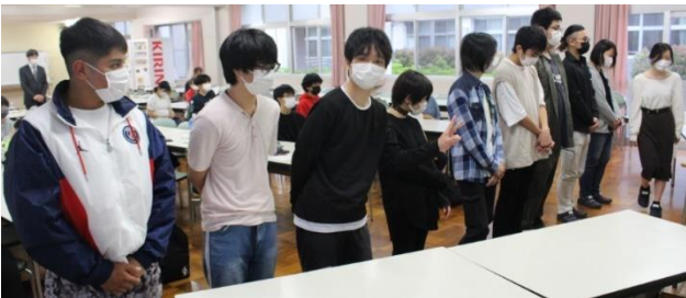
前期生徒会オールスターズ

学校行事については今年も若干変更となる可能性もあります。校長先生のお話にあった「一隅を照らす」のメッセージに倣って、一つ一つの行事を大切にしていきたいですね。