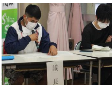
司会、会計長が進行を進めます